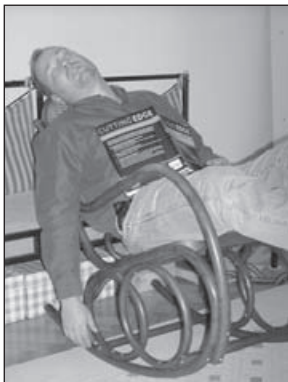
student běžné jazykové školy

SPŠ strojnická, Sokolská 1, 602 00 Brno-střed tel.: 549 249 157, 603 526 019 tel./fax: 549 256 102